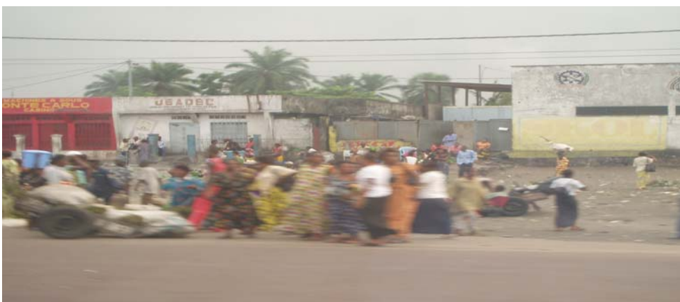
(Kinshasa, Kongo 2007.)

Advokatfirmaet G-Partner AS er først og fremst kjent for å bistå oppdragsgivere med forbygging og gransking av økonomiske misligheter. Våre oppdragsgivere er som regel ledelsen i virksomheter som ønsker å iverksette eller ajourføre forebyggende tiltak for å unngå misligheter. Vi utfører også gransking for oppdragsgivere som har mistanke om økonomiske misligheter, begått i eller utenfor virksomheten enten det gjelder offentlig virksomhet, private bedrifter eller organisasjoner.