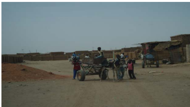
(Khartoum, Sudan 2007. Foto: Erling Grimstad)

Advokatfirmaet G-Partner AS er etablert for å bistå næringslivet, offentlig sektor og organisasjoner i kampen mot korrupsjon og andre former for misligheter og kritikkverdige handlinger.