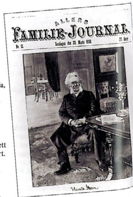
↑ HENRIK IBSEN fylte hele forsiden av Allers på sin 70-årsdag 20. mars 1898.

– Dukkemøbler, fastslår fotografen respektløst. Værelset er dunkelt. Dagslyset stenges ute av tunge gardiner,