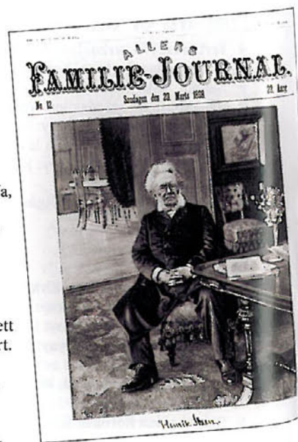
↑ HENRIK IBSEN fylte hele forsiden av Allers på sin 70-årsdag 20. mars 1898.

Værelset er dunkelt. Dagslyset stenges ute av tunge gardiner,